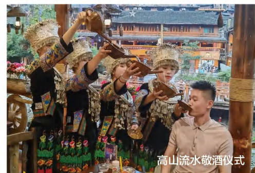
高山流水敬酒儀式